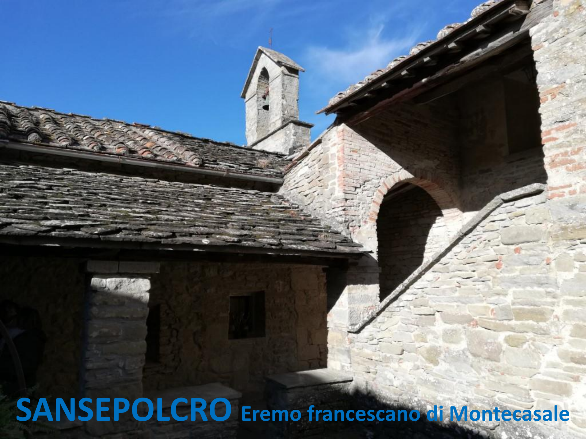
SANSEPOLCRO Eremo francescano di Montecasale