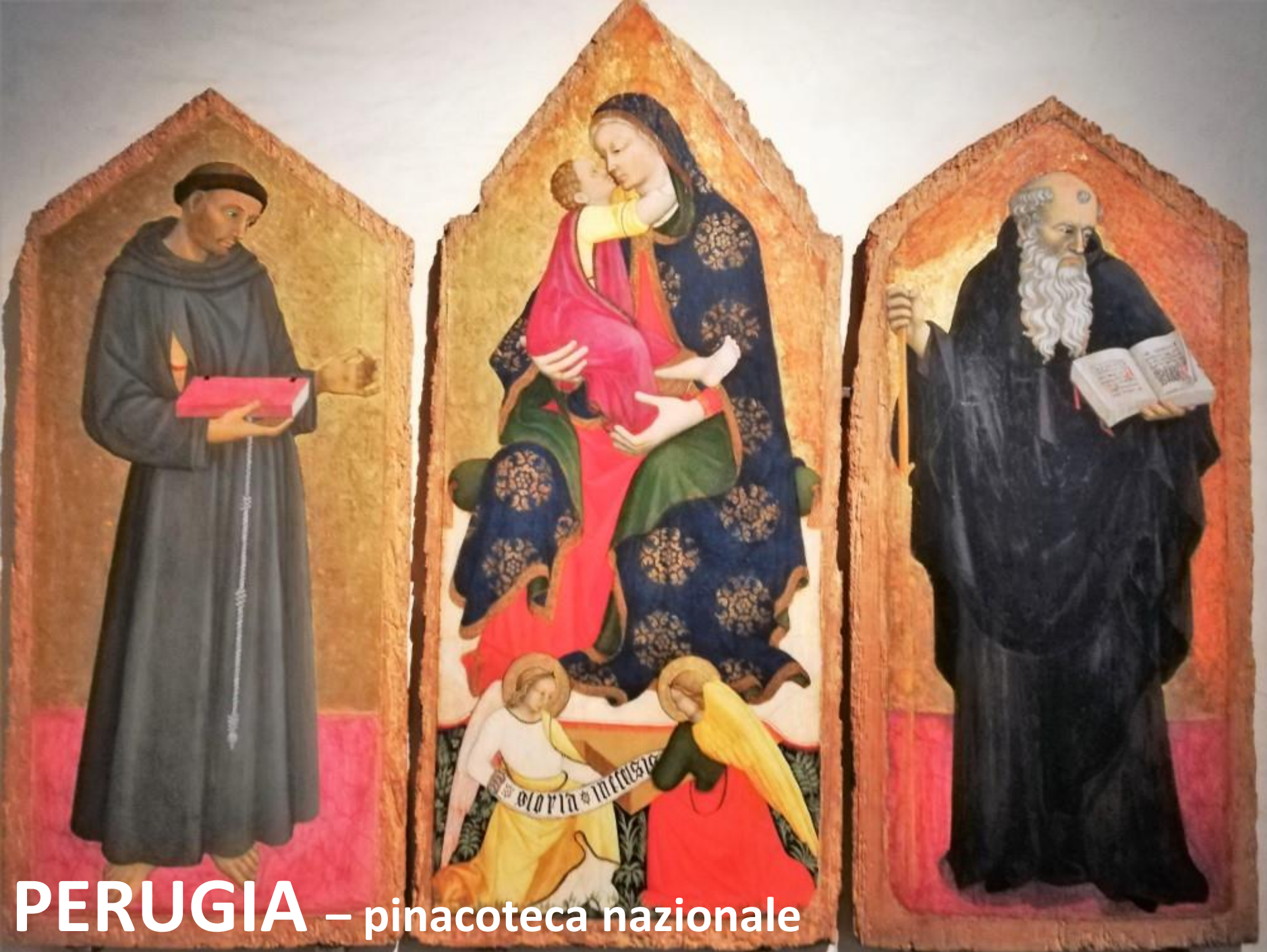
PERUGIA – pinacoteca nazionale