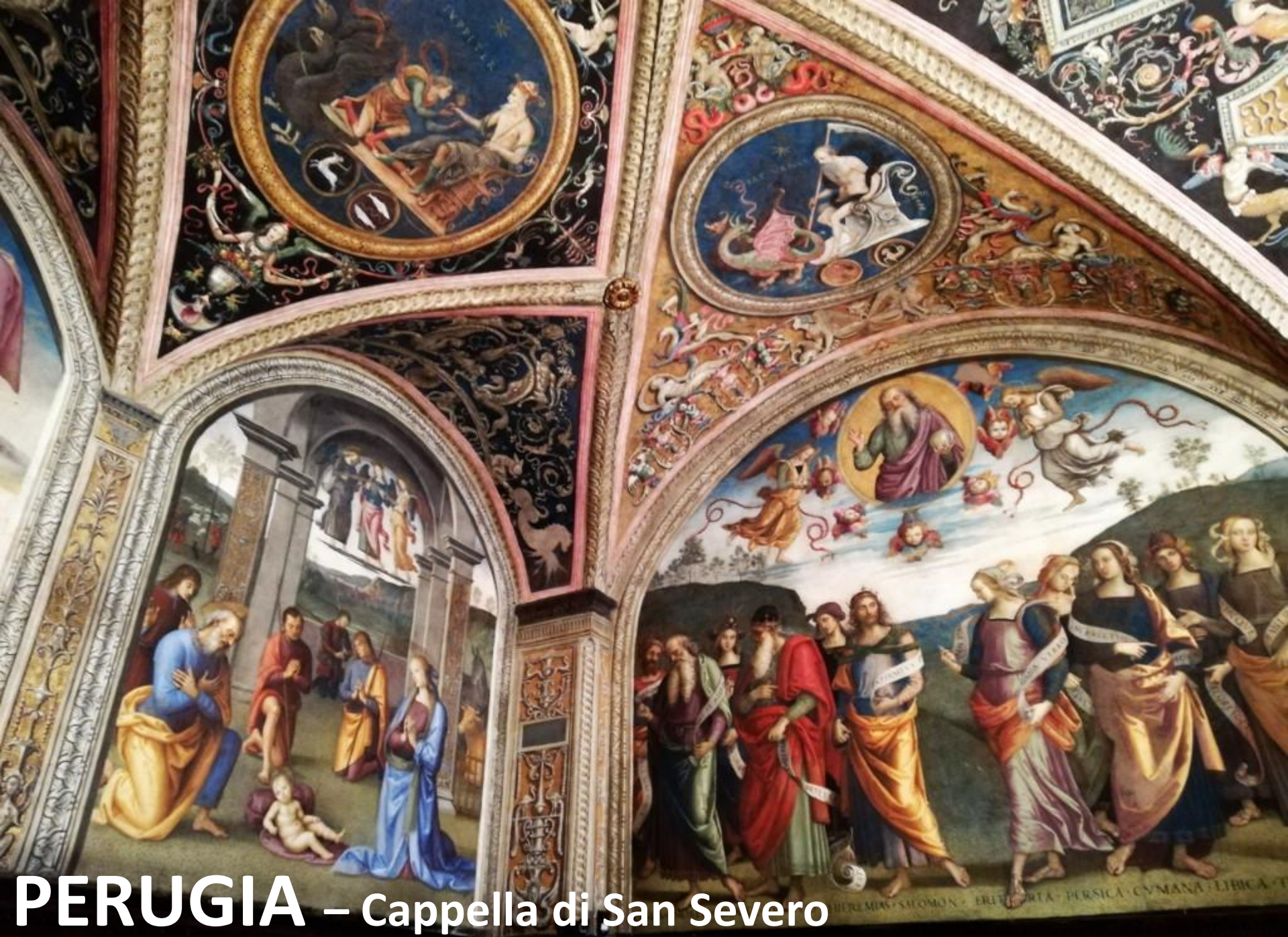
PERUGIA – Cappella di San Severo